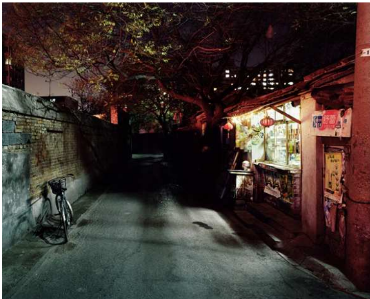
© Ambroise Tézenas, Hutong no 1 , 2002

En collaboration avec www.labelexpositions.com