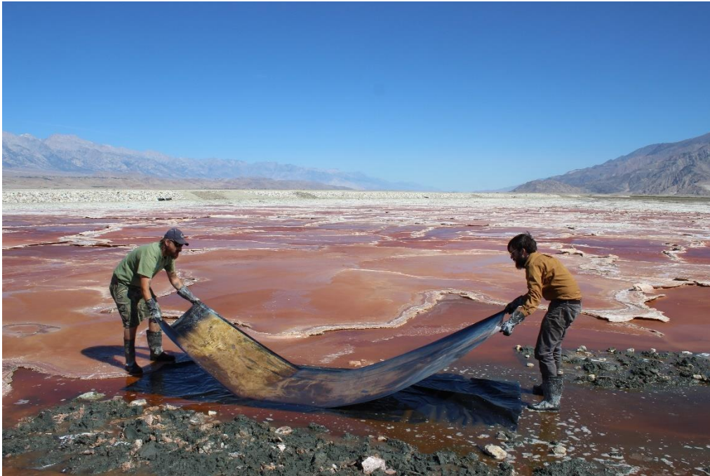
© Optics Division of the Metabolic Studio

Mining Photography widmet sich der materiellen Geschichte der wichtigsten Ressourcen, die zur Herstellung von Bildern verwendet werden, und geht dabei auf den sozialen und politischen Kontext ihres Abbaus und ihrer Verschwendung sowie auf ihre Beziehung zum Klimawandel ein. Seit ihrer Erfindung ist die Fotografie von der weltweiten Gewinnung und Ausbeutung sogenannter natürlicher Ressourcen abhängig. Im 19. Jahrhundert waren dies Bitumen, Kohlenstoff, Kupfer oder Silber, zu deren größten Verbrauchern die Fotoindustrie Ende des 20. Heute, mit der Digitalfotografie, hängt die Bildproduktion von seltenen Erden und Metallen wie Coltan, Kobalt und Europium ab. Mit historischen Fotografien, zeitgenössischen künstlerischen Vorschlägen und Interviews mit Experten erzählt die Ausstellung die Geschichte der Fotografie als industrielle Produktion und zeigt, wie tief dieses Medium mit der Entwicklung der Umwelt durch den Menschen verbunden war.